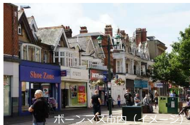
ボーンマス市内 (イメージ)